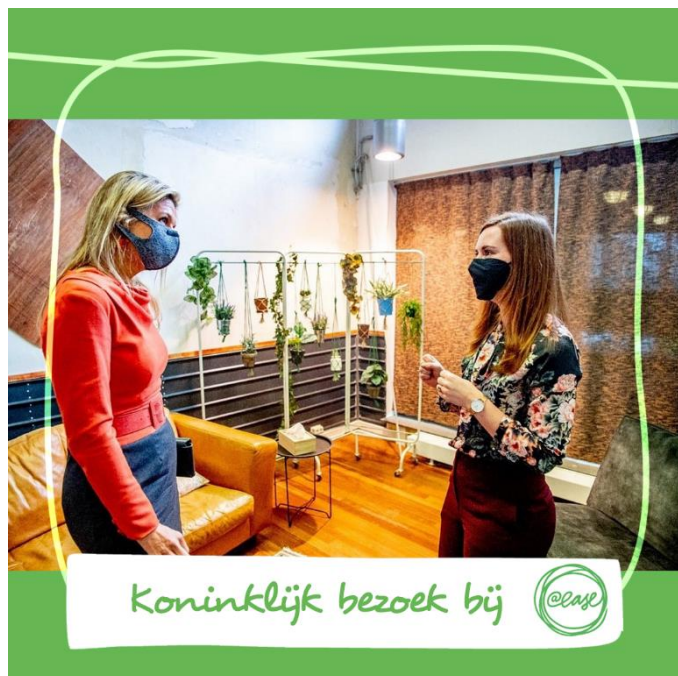
Koninklijk bezoek bij

In 2021 startte ook het project 'Everybody @ease' via een gehonoreerde subsidieaanvraag van FNO. Via dit project zetten we nog meer in op het bereiken van jongeren die we nu nog niet bij @ease zien en waarvoor we preventief willen opschalen. Via een pilot in Zuid-Limburg en Amsterdam zoeken we deze jongeren op (via een outreachende variant van @ease) bij hun (MBO)school en in de wijk i.s.m. lokale partners. Uiteindelijk is het doel deze jongeren vroeg in beeld te krijgen en via @ease en de samenwerkende lokale partners hulp op maat te bieden.